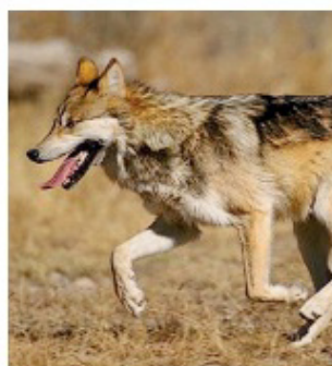
PREDATORE Un lupo

La presenza dell'animale deve essere monitorata per garantire una gestione corretta e priva di rischi